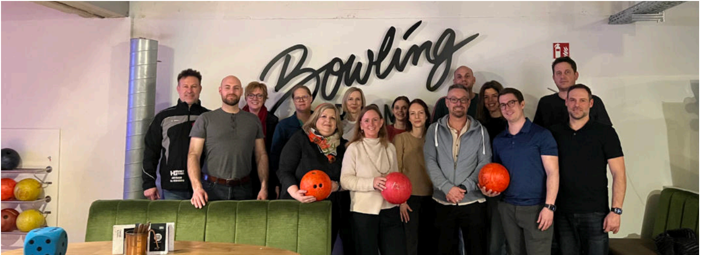
Die Mitglieder des BezirksverbandsTrier im Bowlingroom während der gemeinsamen Bowlingrunde.

Unter dem Motto „Bowling im BV“ lud der Bezirksverband Trier am 5. März 2026 im Bowlingroom Trier zu einer lockeren Bowlingrunde ein.